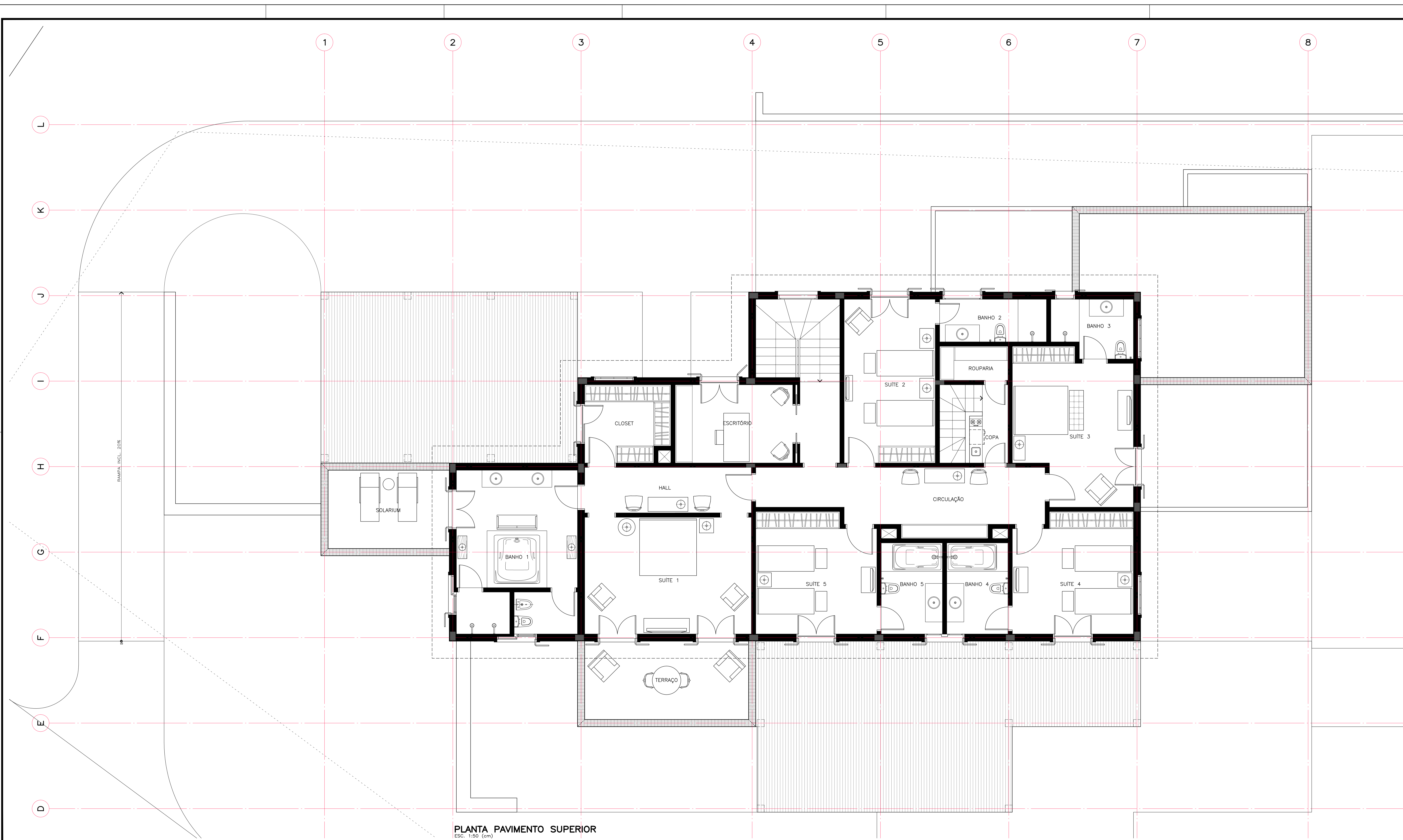
PLANTA PAVIMENTO SUPERIOR ESC. 1:50 (cm)